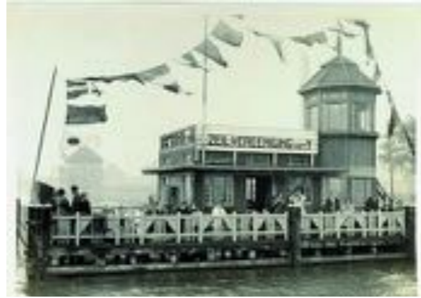
De haven aan de Grasweg in Amsterdam-Noord

“We hebben een hele mooie clubark en havenark in de haven van Durgerdam, met onze verenigingsbar. Daar organiseren we ook jaarlijks de jeugdlessen op zaterdag en zondag in Optimistjollen, Lasers en Pico's. Elk jaar zijn er twee grote zeilevenementen, de Y-toren race, begin mei, en de Pampusregatta, begin september, waar vaak zo'n 60 tot 80 schepen aan mee doen. Dan is het groot feest op de haven! Vanuit Marken organiseren we elk jaar de '6-uur