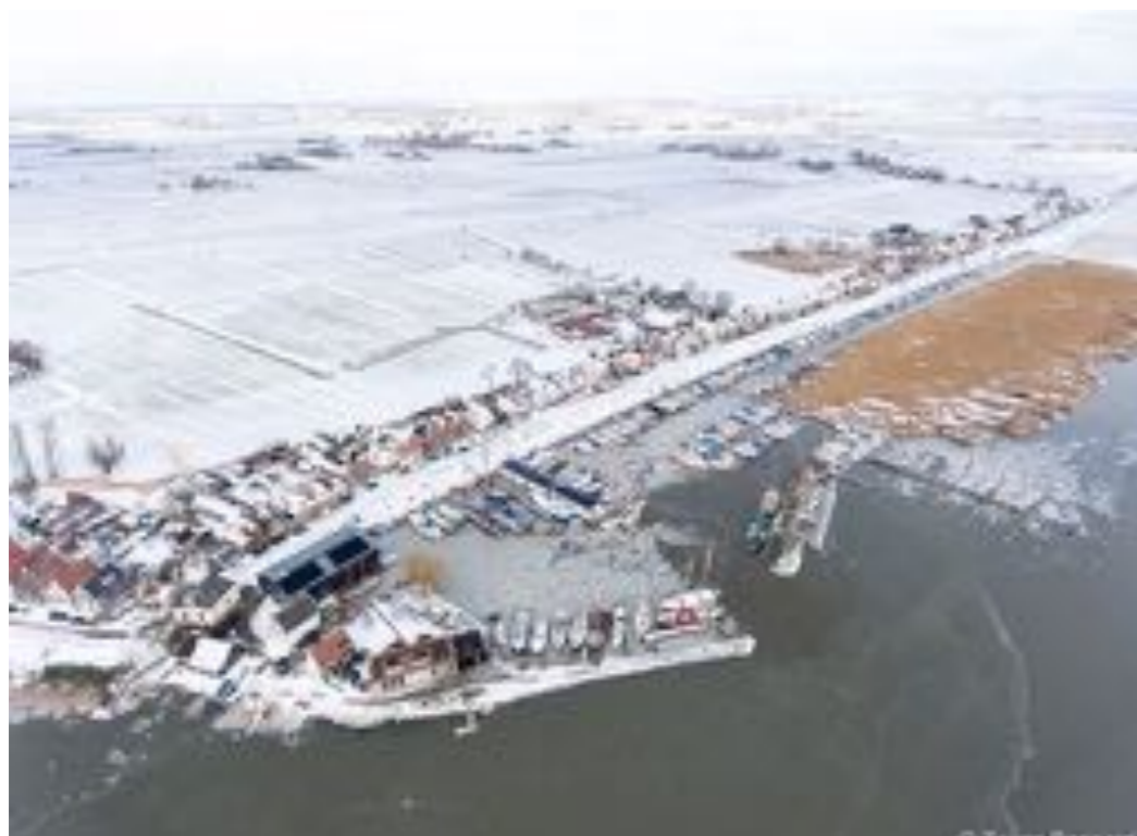
Februari 2021.