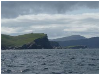
Diepe baaien, rotsige kappen en lochs