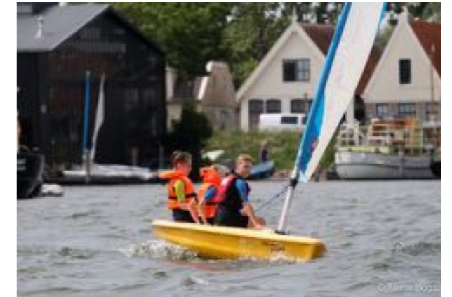
Het jeugdzeilen met Lasers en Pico's

De zorg voor het milieu, waaronder het water waarin we varen, is niet meer weg te denken bij een zeilvereniging. Belangstellenden kunnen hierover informatie inwinnen bij Frank London, FHPLondon@planet.nl.