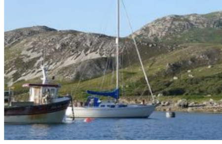
Aan een meerboei in Loch Eriboll

Na de kaap, onder de beschutting van de noordkust, werd het gelukkig veel rustiger. Ook hier was de kust ruig en rotsachtig en wisselden baaien, lochs en kappen elkaar voortdurend af. Het weer werd steeds beter, golven stonden er nauwelijks en de afluende wind voerde zeer warme lucht aan. Ik begon het in mijn zeilpak behoorlijk warm te krijgen. In de loop van de middag kwam de ingang van Loch Eriboll in zicht en onder zeer zomerse omstandigheden voer ik het schitterende, door bergen en heuvels omzoomde loch binnen. De plaats waar ik wilde ankeren lag in de zuidoosthoek. Er waren verschillende goede ankerplekken, maar ik had juist deze uitgekozen omdat ik daar goed beschut lag tegen de zuidenwind en de oostenwind die 's nachts zou gaan waaien.