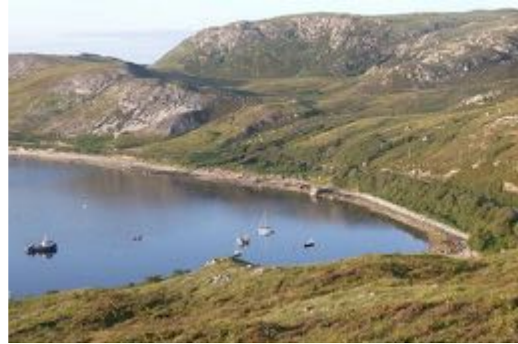
Diep onder me zie ik mijn schip liggen

Maar het leek erop dat ik niet lang meer van dit schitterende uitzicht kon genieten. Een vissers-scheepje voer recht mijn kant uit. Ik bereidde me er al op voor dat ik zou moeten verkassen, maar het was loos alarm. De vissers maakten vast aan de boei vlak naast de mijne. Ik deed maar of mijn neus bloedde, groette ze vriendelijk en mijn groet werd vriendelijk beantwoord. Hun vangst deden ze in een drijvende bak. Vervolgens voeren ze met het ding naar het strandje. Daar stond een vorkheftruck die de bak uit het water tilde en ermee naar een hoger gelegen plek reed. De vangst werd daar in een vrachtbusje geladen.