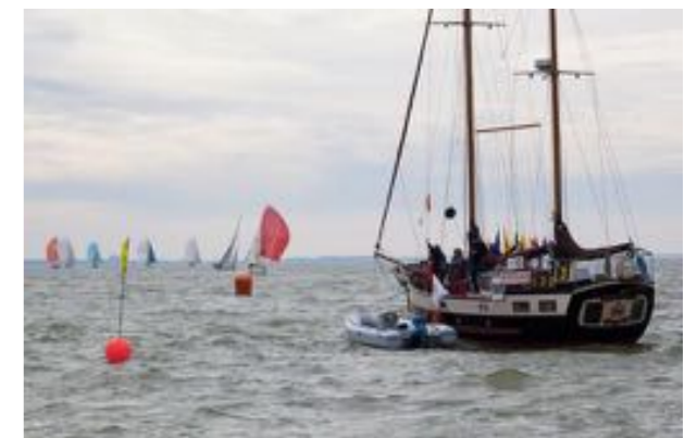
De Faja Lobbi als startschip bij de eerste Pampusregatta in 2015.

door de haven: die sinaasappel stuitert over het water totdat ie wat tegenkomt, die hebben dan meteen jus d'orange aan boord. Die jeugddagen waren trouwens ook altijd een mooi gebeuren, je kon abseilen van de mastenkraan, varen in een jolletje en op vloten en dan waren wij het piratenschip. Allemaal verkleed als piraat en waterballonnen waren onze kogels.