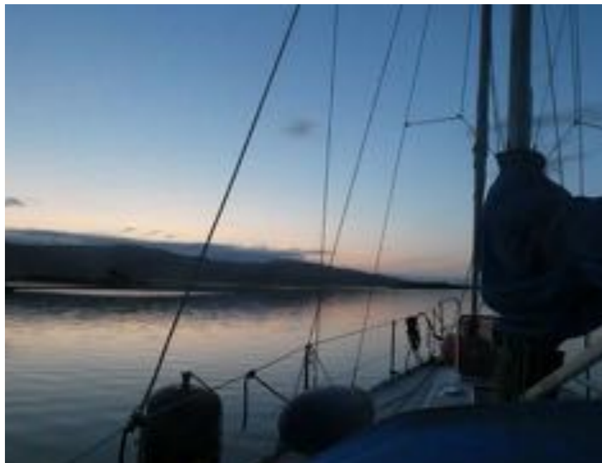
Boven: Avondstemming na de bergwandeling