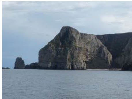
Rechtsonder: Weer bijna op de oceaan kan ik genieten van het uitzicht op de volgende kaap