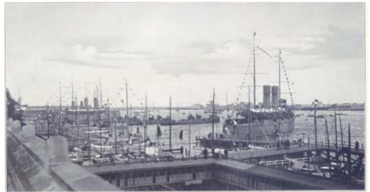
Gezicht op veesteiger en jachthaven der Zeilvereeniging „Het IJ" 1855-1919 (Overgenomen uit The Port of Amsterdam, publ. by the Municipality of Amsterdam, 1914)