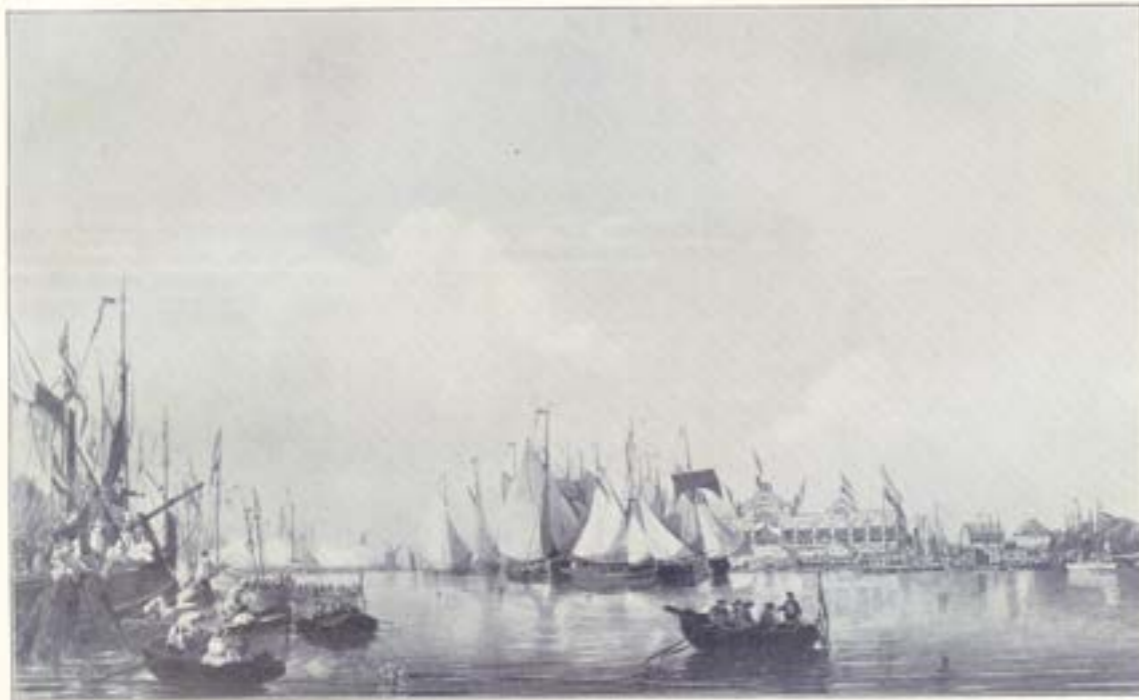
De eerste wedstrijd der Kon. Ned. Yacht Club op het IJ te Amsterdam 10 Sept 1846

voor het publiek leverde de strijd der jachten een fraai schouwspel op. Maar de oude band was er toch niet meer. Een band, leiding, een jachthaven, die hadden het zeilen tot nieuwen bloei kunnen opheffen.