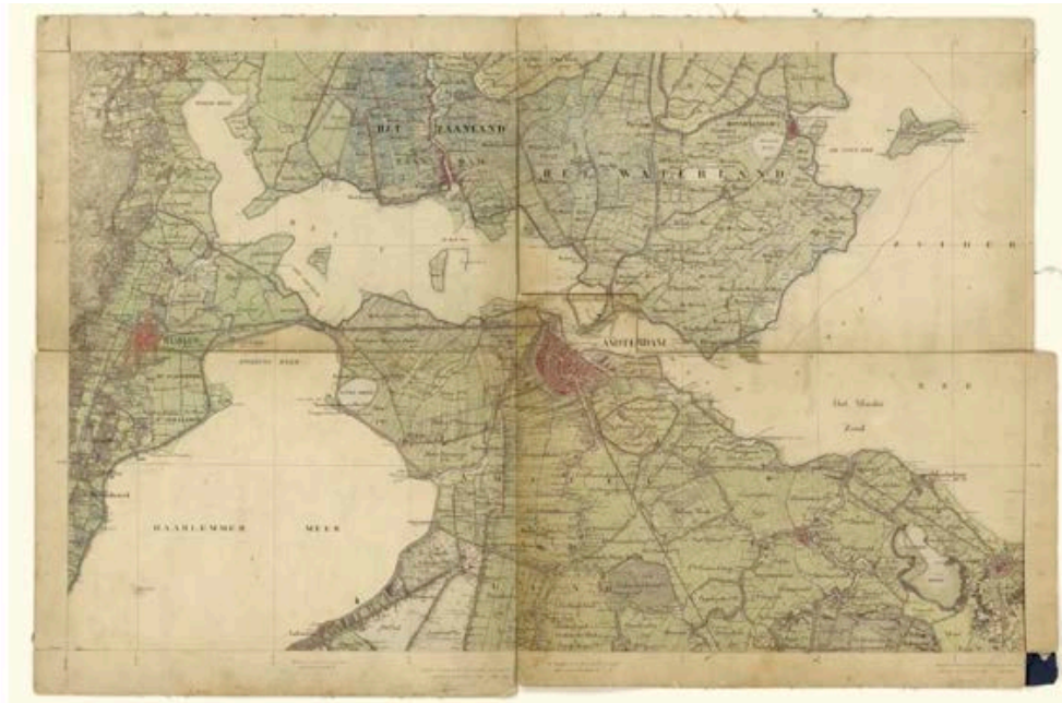
Het IJ in 1850

Zet het blauw van de zee tegen het blauw van de hemel veeg er het wit van een zeil in en de wind steekt op