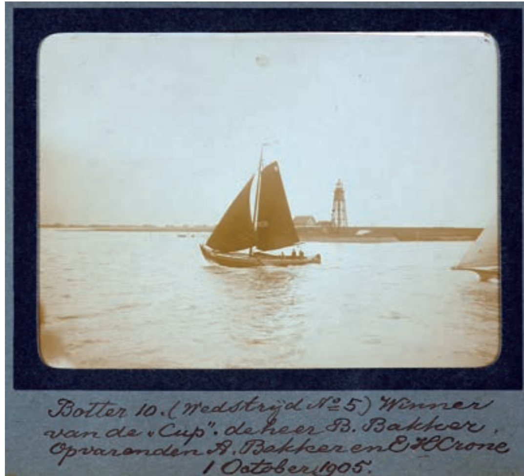
Een pagina uit een klein fotoalbum met de winnende botter in 1905.