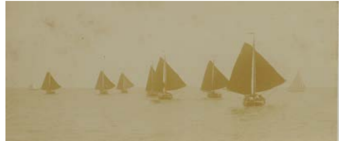
Botterwedstrijd op het (Buiten-) IJ - rond 1900