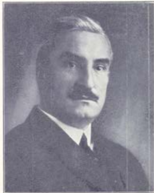
H. Kersken Hzn. 1919—heden

Voorzitters der Zeilvereeniging „Het IJ”.